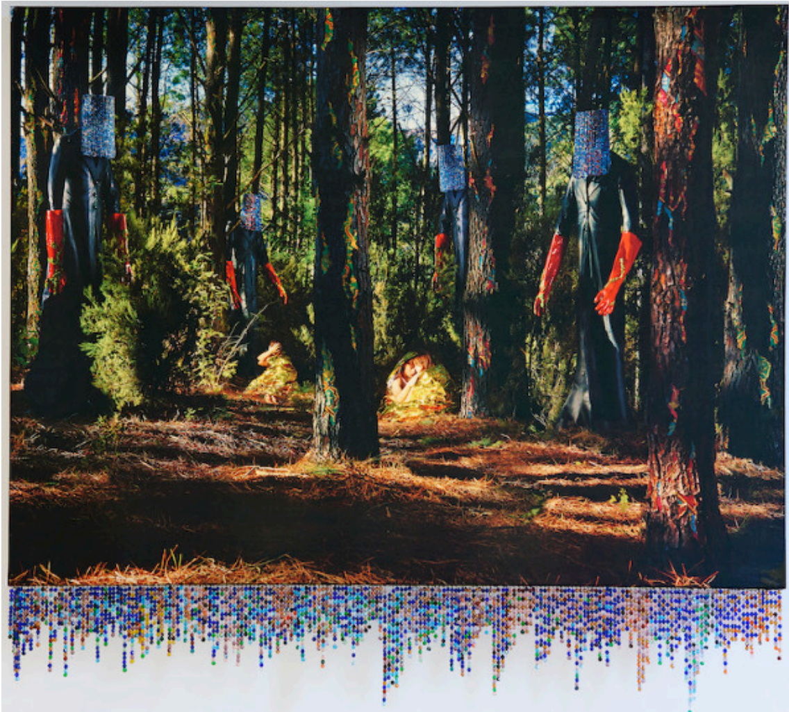
Salle N°3 Musée des Matelles - Maison des Consuls LE SOMMEIL DE LA RAISON ENGENDRE DES MONSTRES - 2025 Impression photo sur tissu velours - châssis bois - caisson lumineux - perles de bohèmes 135cmx184cm.

Ci-dessous vous trouverez un lien qui présente l'exposition en images. Cette vidéo est accompagnée des extraits des conditions de réalisation des photos, leur tournage en extérieur, à l'instar de la pièce LE SOMMEIL DE LA RAISON ENGENDRE DES MONSTRES, présentée ci-dessus. Souligner les conditions de création, à travers cette vidéo, c'est rappeler l'obsession de l'artiste à photographier le réel.