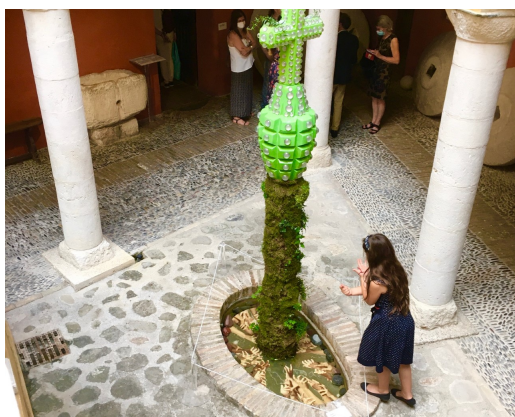
HOLLY HANDGRENADE - 2020