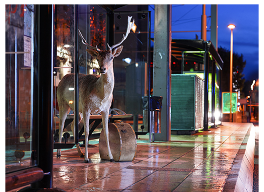
Voyage au bout de l'Enfer 2 - 2015