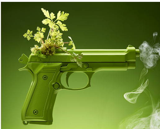
PRETTY PLANT'S REVENGE - 2015