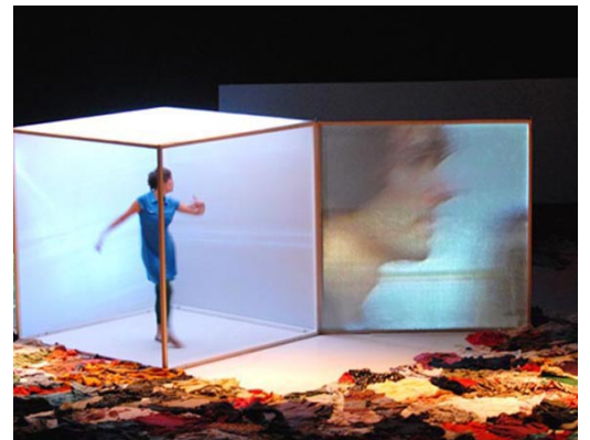
Chorégraphe Lionel Hoche- VORTEX- 2006