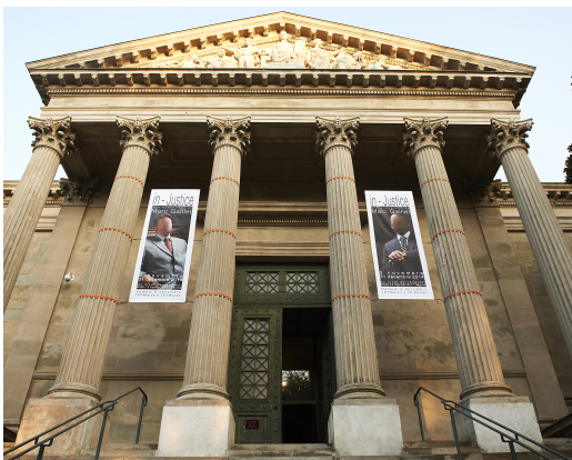
Façade du Palais de Justice de CARCASSONNE - 2014